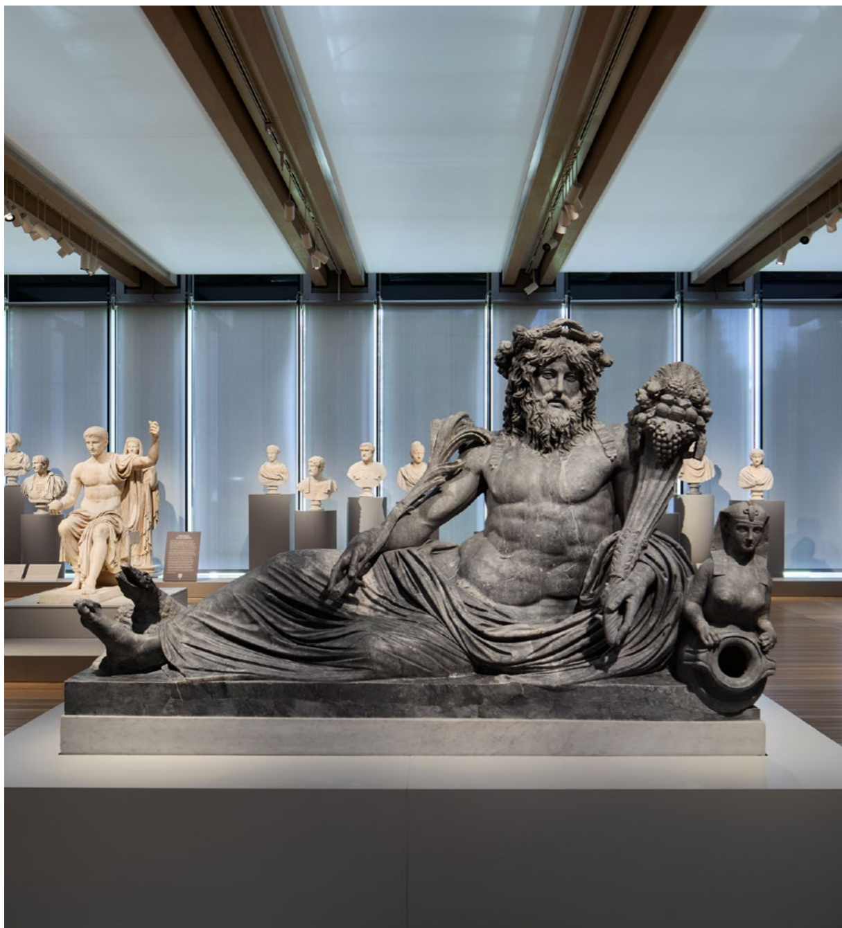
Myth and Marble: Ancient Roman Sculpture from the Torlonia Collection. Installation view, Kimbell Art Museum, Fort Worth.

La Fondazione ha inoltre, ha contribuito al restauro degli affreschi interni del Palazzo Corvaja di Taormina, che raccontano la storia della Sicilia come punto nevralgico e crocevia di scambi commerciali nei secoli. Il restauro si concluderà nel 2026.