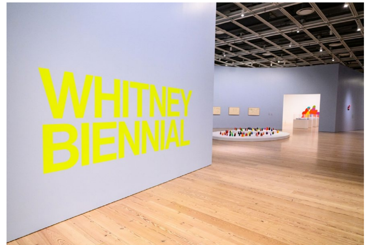
Exhibition view, 82esima Biennale del Whitney, 8 marzo – 23 agosto 2026

dei giovani artisti che unisce il MAXXI Museo nazionale delle arti del XXI secolo e Fondazione Bvlgari e che negli anni ha proiettato sulla scena internazionale numerosi talenti italiani.