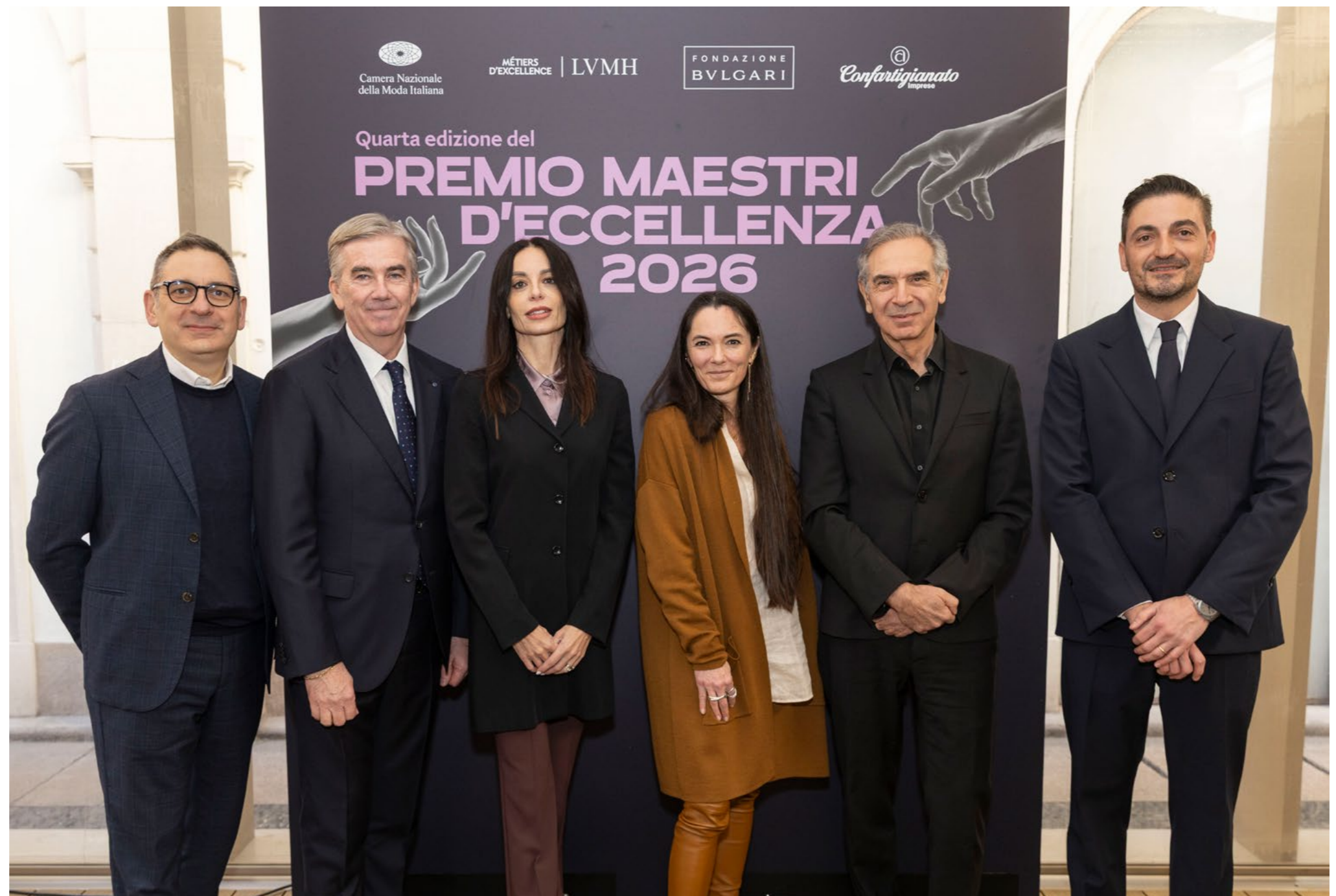
Conferenza stampa IV Edizione Maestri d'Eccellenza, 24 febbraio 2026

Massima espressione di una missione che appartiene integralmente all'identità di Bvlgari, la Fondazione si impegna a costruire un futuro migliore attraverso la cura, la generosità e una dedizione costante alla realizzazione di tali obiettivi. Nella ferma convinzione che la magnifica bellezza della diversità umana migliori la vita di ciascuno, Fondazione Bvlgari si propone di rivelare, alimentare e valorizzare l'infinito potenziale e la straordinaria bellezza che si nascondono in ogni ambito in cui essa opera e in tutti coloro che sono coinvolti nelle sue azioni.