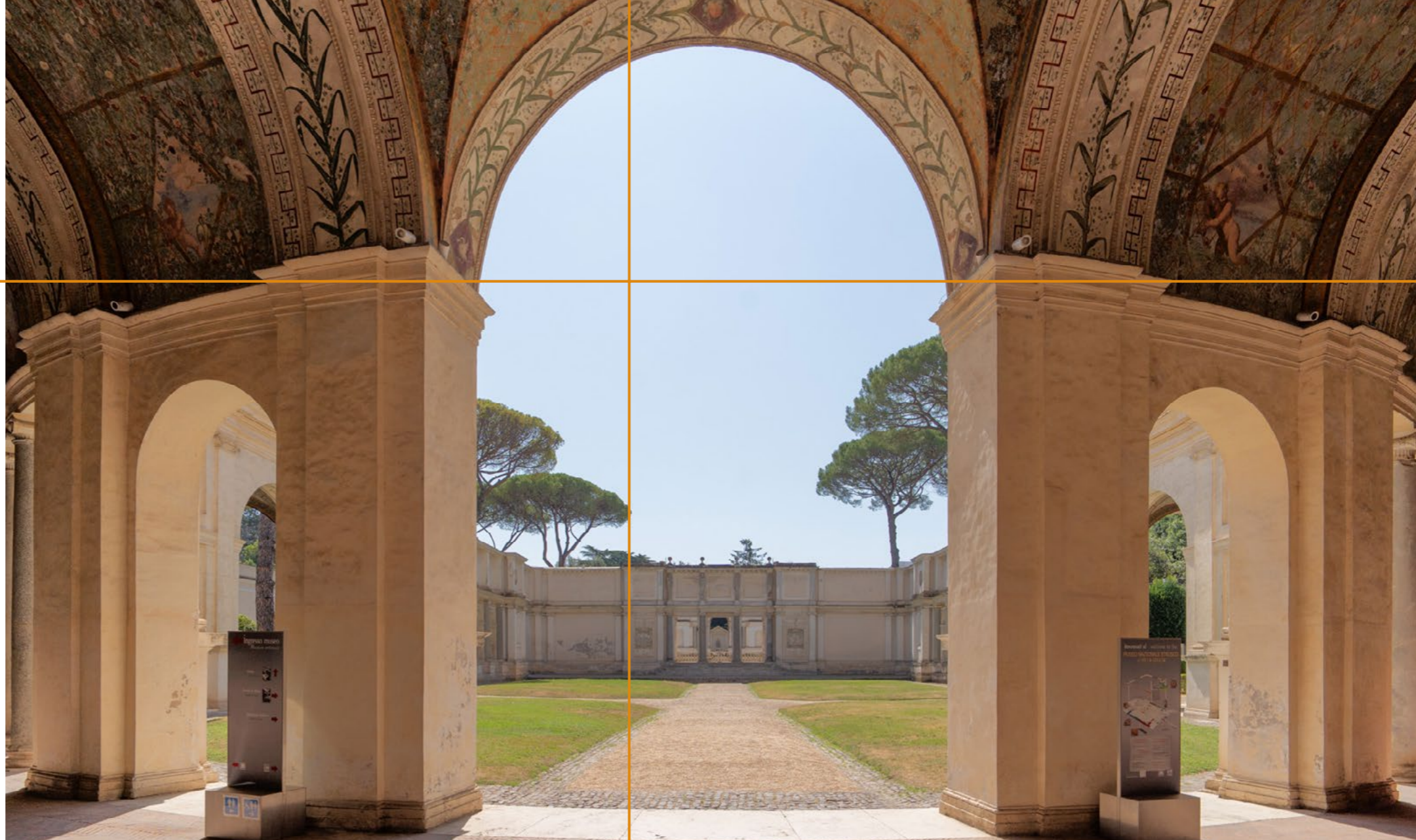
Il cortile del Museo Nazionale Etrusco di Villa Giulia.