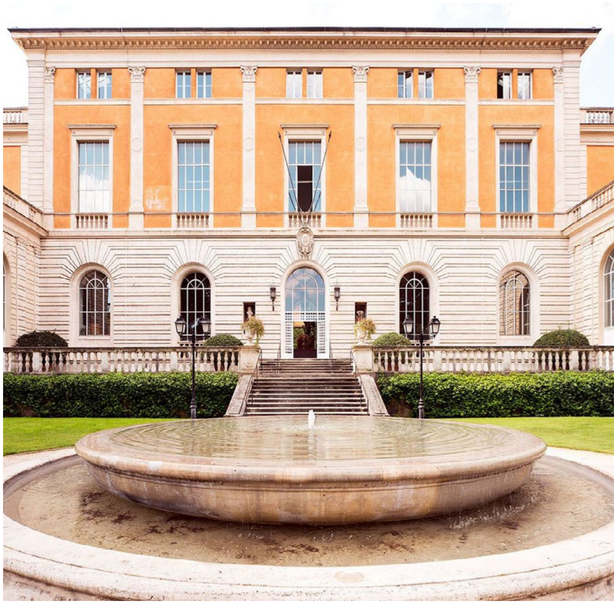
American Academy in Rome

Infine, la Fondazione ha sottoscritto l'accordo di Fellowship con l'American Academy di Roma per accogliere nella comunità dell'Accademia artisti di rilievo emergenti dal Premio Maxxi Bulgari, principale premio italiano dedicato al sostegno e alla promozione delle nuove generazioni, e dalla Biennale del Whitney Museum più longeva rassegna sull'arte americana.