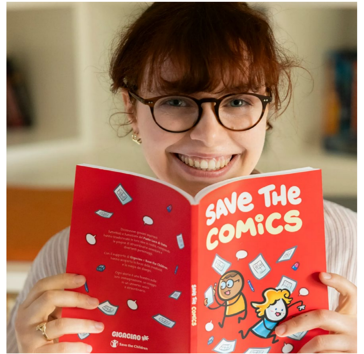
Masterclass con la fumettista Teresa Cherubini al Punto Luce delle Arti di Ostia, 18 aprile 2025

re la collaborazione. Per aumentare la consapevolezza e raggiungere un pubblico sempre più ampio, con l'obiettivo di condividere questo percorso di lunga data con le nuove generazioni. attraverso masterclass presso alcune delle principali università internazionali, proponendo un modello replicabile.