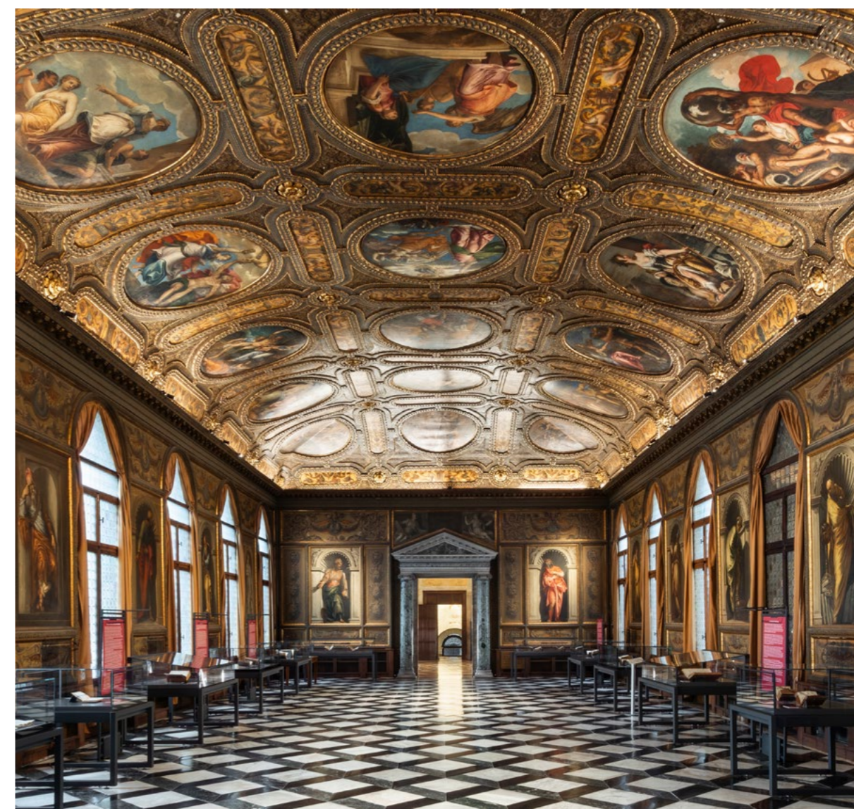
Sala Sansovino, Biblioteca Nazionale Marciana