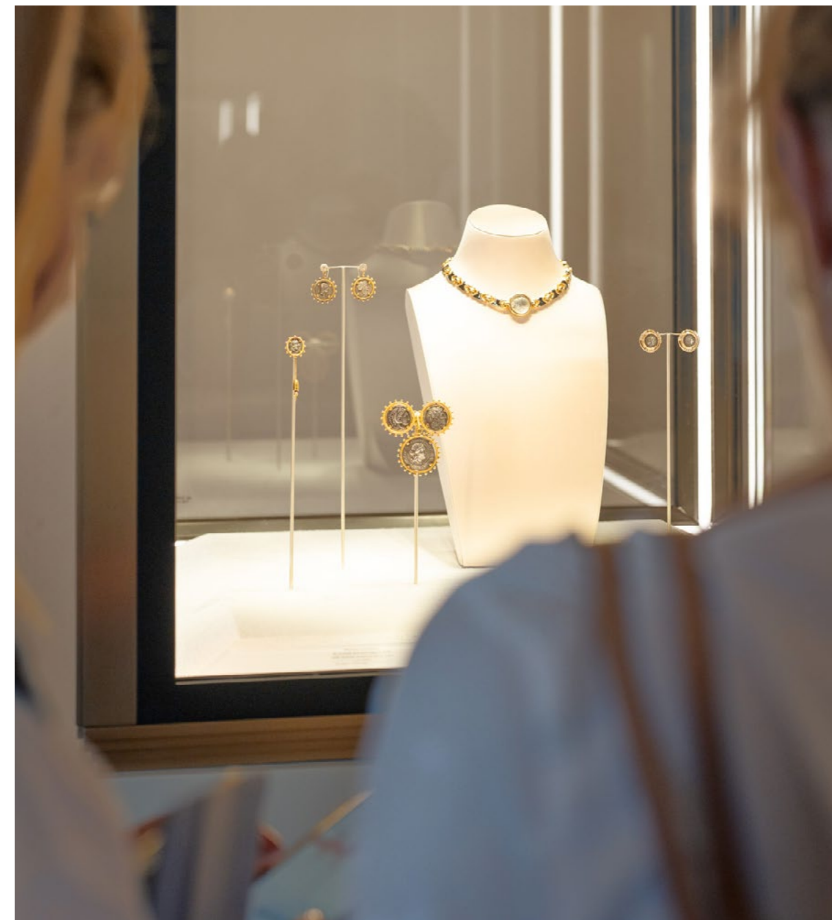
Inaugurazione "Una storia infinita. Arte orafa da Castellani a Bvlgari", Museo Nazionale Etrusco di Villa Giulia, 23 giugno 2025

La Fondazione ha inoltre, ha contribuito al restauro degli affreschi interni del Palazzo Corvaja di Taormina, che raccontano la storia della Sicilia come punto nevralgico e crocevia di scambi commerciali nei secoli. Il restauro si concluderà nel 2026.