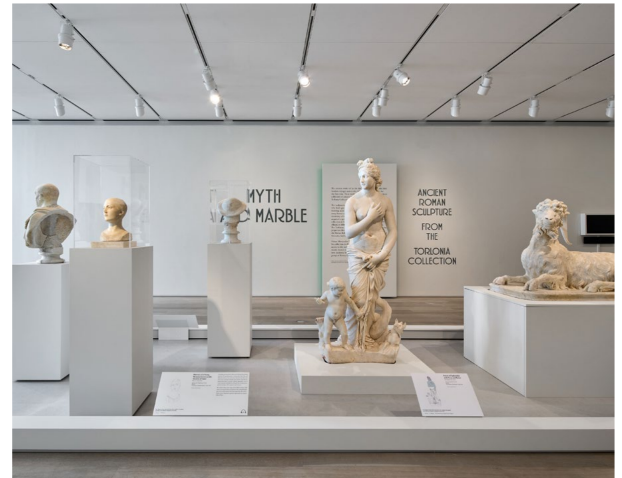
Myth and Marble: Ancient Roman Sculpture from the Torlonia Collection. Installation view, Art Institute of Chicago.

mostra al Kimbell Art Museum di Forth Worth e concluso al Museo delle Belle Arti di Montreal, Canada nel 2026.