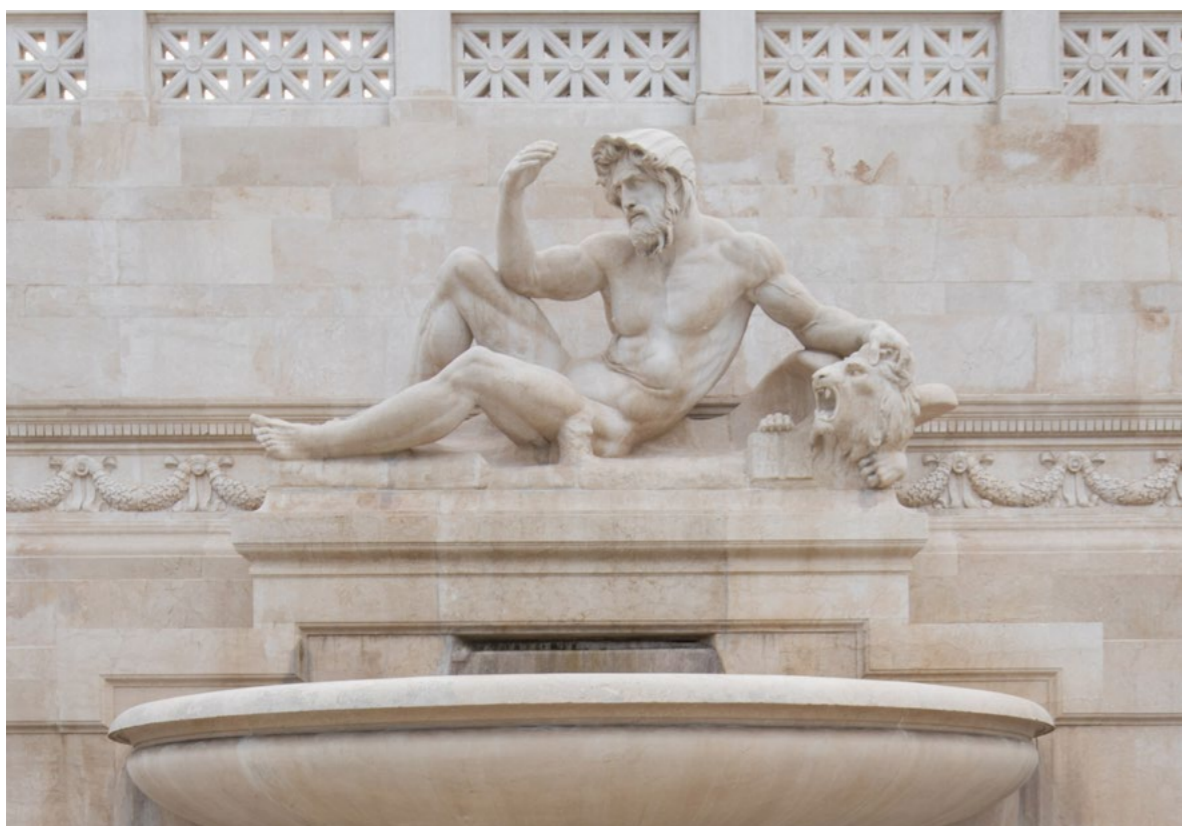
Mar Tirreno di Pietro Canonica, Restauro del Vittoriano a firma di Bulgari Spa, 2024

Nel 2024 nasce la Fondazione Bvlgari con lo scopo di valorizzare l'ambiente e la società attraverso un impegno a lungo termine fondato sulla filosofia del "give back", restituire: elevare la vita portando alla luce la straordinaria bellezza della diversità umana. Collaborazioni con enti di beneficenza, investimenti per il potenziamento delle infrastrutture educative, contributi finanziari per la conservazione del patrimonio culturale italiano, supporto per la comunità artigiana.