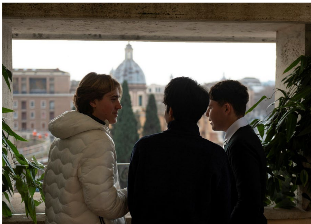
Visita al BHR Roma degli studenti del CMFP Castelfusano Ostia, 14 gennaio 2026.